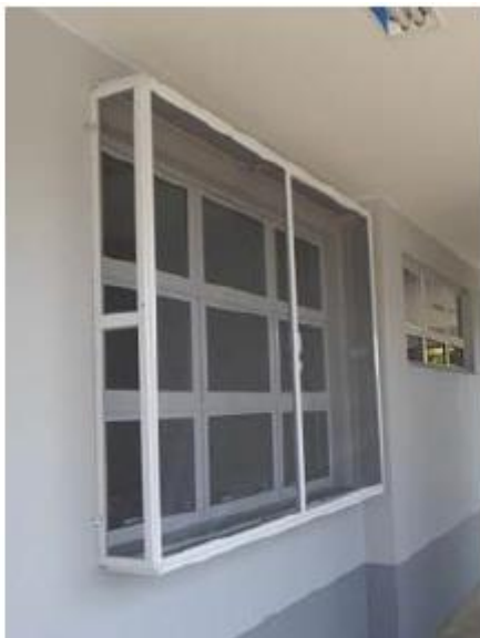
Figura 03 – Tela mosquiteira

No depósito de alimentos serão instaladas grelhas de ventilação em alumínio e uma porta em alumínio veneziana com vidro temperado 6.00 com acionamento do tipo vai e vem, na medida de 0,80x2,10m.