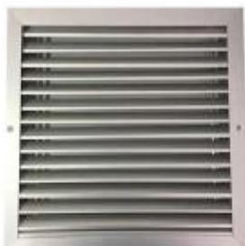
Figura 04 – Grelha de ventilação.

CNPJ: 76.995.414/0001-60 e-mail: prefeitura@chopinzinho.br Telefone (46) 3242-8600 Rua Miguel Procópio Kurpel, nº 3.811, Bairro São Miguel 85.560-000 CHOPINZINHO PARANÁ