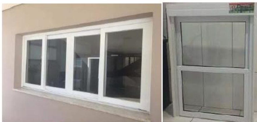
Figura 02 – Aberturas da Cozinha do tipo correr e guilhotina

Esta deverá receber uma demão de fundo nivelador e duas demãos de tinta esmalte acetinado em cor a ser definida. Também haverá uma janela de correr 4 folhas em alumínio com medida de 3,50x0,80m. E duas janelas do tipo guilhotina voltadas para área do refeitório, nestas serão distribuídos os alimentos e recebidos os utensílios sujos.