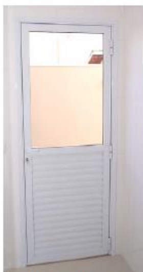
Figura 05 – Porta do depósito de alimentos, acionamento vai e vem.