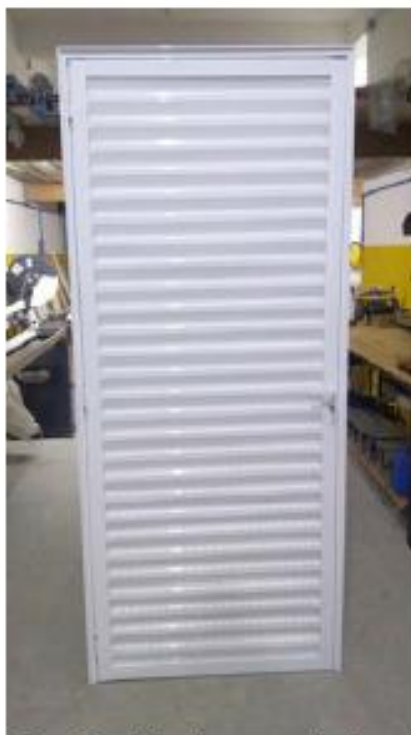
Figura 01 – Modelo de porta da Lavanderia

CNPJ: 76.995.414/0001-60 e-mail: prefeitura@chopinzinho.br.gov.br Telefone (46) 3242-8600 Rua Miguel Procópio Kurpel, nº 3.811, Bairro São Miguel 85.560-000 CHOPINZINHO PARANÁ