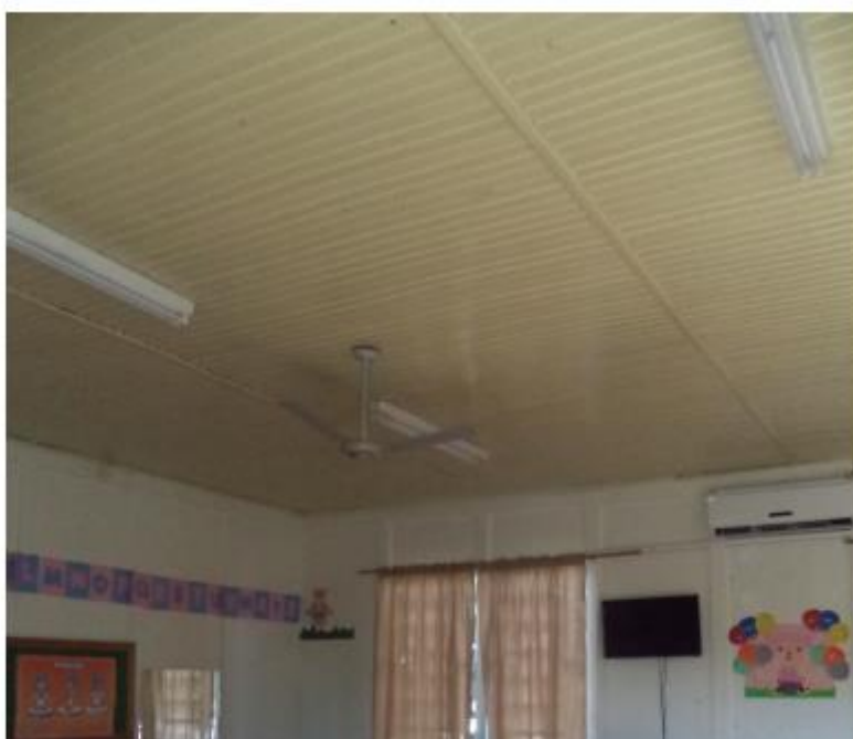
Foto 03 – Forro de madeira em boas condições de conservação (sala de aula)